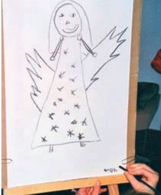
Kinderzeichnungen Engel, Technik: Kohle