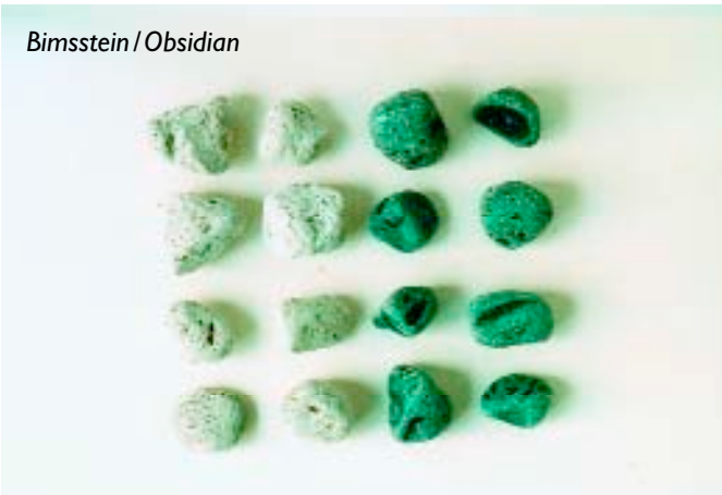
Bimsstein / Obsidian