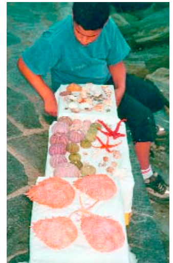
Knabe mit sortierter Sammlung von Muscheln, Seesternen, Seeigeln und Krebspanzern.