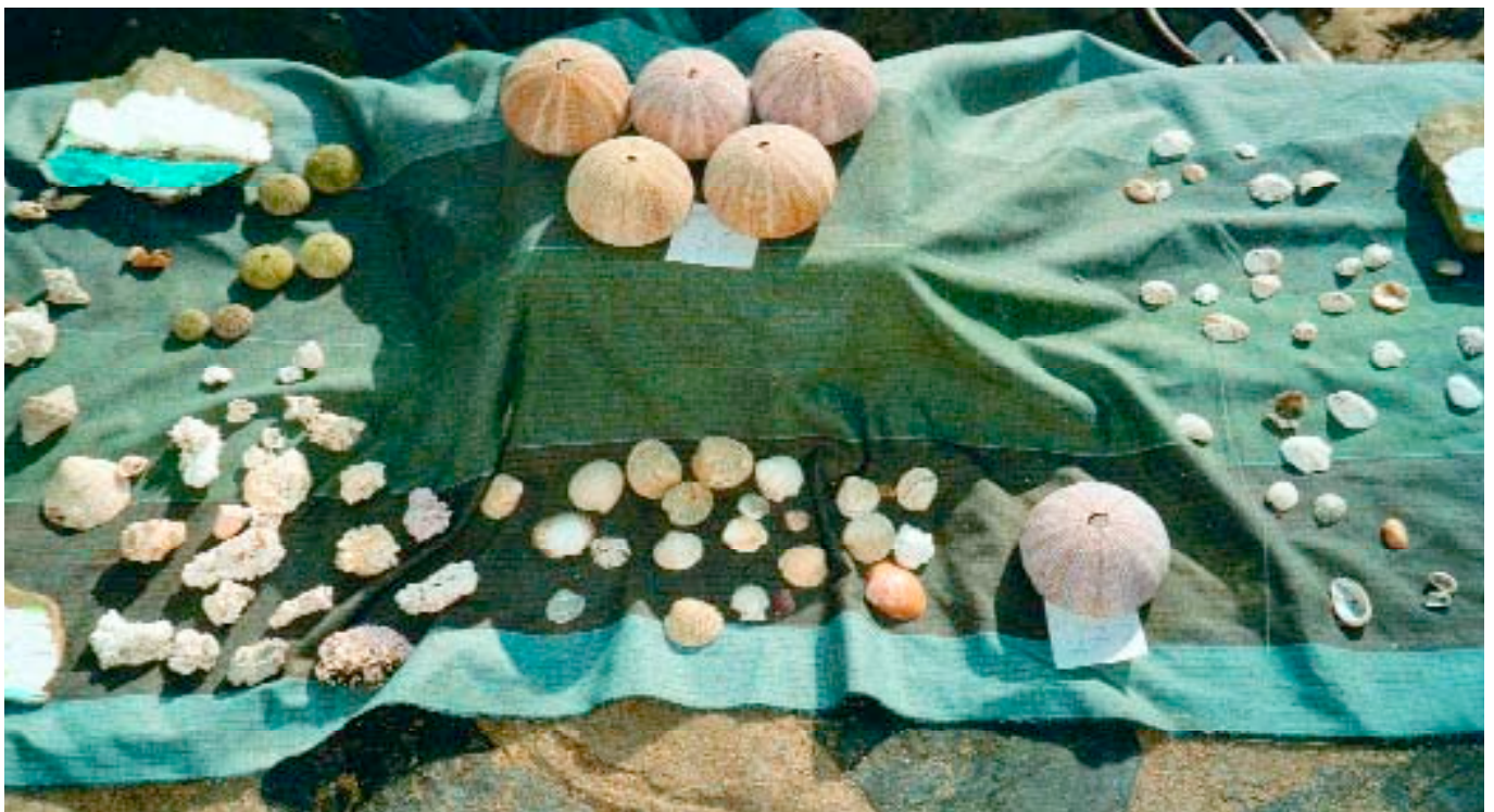
12 Kindliche Sammlungsausstellung auf Tüchern.